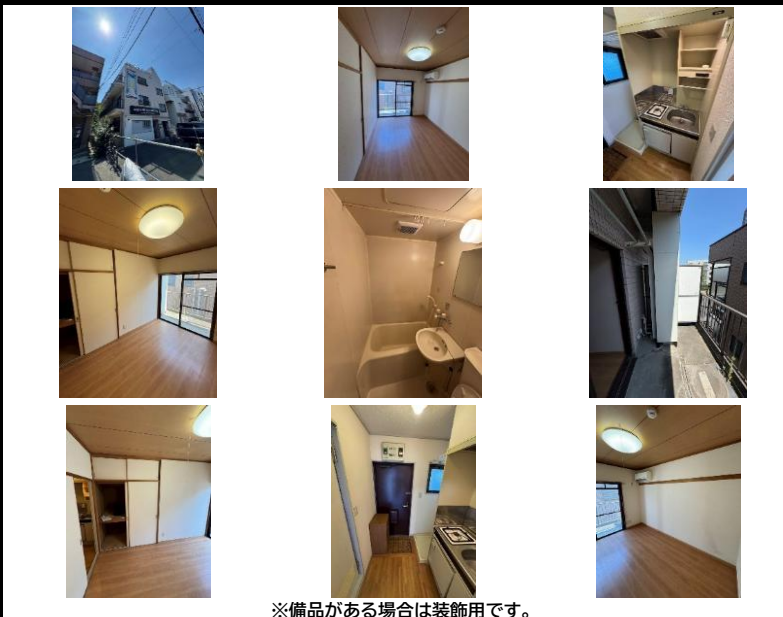
※備品がある場合は装飾用です。