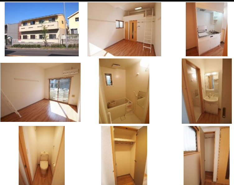
※写真は別室のものになります。※備品がある場合は装飾用です。

初期費用39,000円又は賃料発生日相談キャンペーンから選択可能。初期費用キャンペーンは、賃料・管理費・24時間安心サポート2料(1ヶ月分)、賃料保証料全て込みです。※仲介手数料・月額火災保険料・鍵交換費用(任意)は別途必要となります。※賃貸借契約開始後1年未満に解約、又は契約締結後～契約開始日までに解約の場合は違約金として「賃料・管理費・24時間安心入居サポート2料」の2ヶ月分相当額をお支払い頂きます。2年未満に解約の場合は違約金として、1ヶ月分相当額をお支払い頂きます。