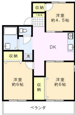
※図面と現況に相違がある場合は、現況を優先と致します。※80m=1分