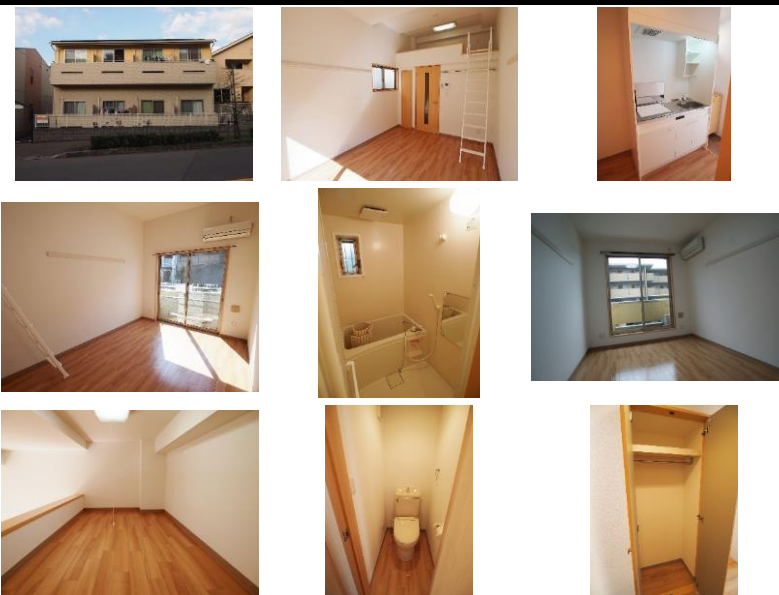
※写真は別室のものになります。※備品がある場合は装飾用です。

初期費用39,000円又は賃料発生日相談キャンペーンから選択可能！初期費用キャンペーンは、賃料・管理費・24時間安心サポート2料(1ヶ月分)、賃料保証料全て込みです。※仲介手数料・月額火災保険料・鍵交換費用(任意)は別途必要となります。※賃貸借契約開始後1年未満に解約、又は契約締結後～契約開始日までに解約の場合は違約金として「賃料・管理費・町会費・24時間安心入居サポート2料」の2ヶ月分相当額、2年未満に解約の場合は1ヶ月分相当額をお支払い頂きます。