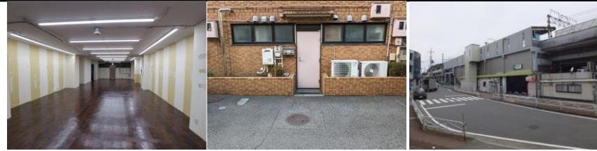
【室内：別室のものになります。】 【裏口側】 【入口側：道路（ロータリー）】

当社指定家賃保証システム要加入。 【保証料：月額賃料等総額×150%】 【継続保証委託料：月額賃料等総額の15%（1年毎）】 当社指定賠償付火災保険要加入。 解約時保証金償却有り。【20%（別途消費税等）】 検査済証：有り。 業種制限：重飲食不可。 ※上記税込金額（保証金は除く）は現行消費税率（10%）にて算出しております。消費税増税後は新たな税率にて算出した金額となります。 ※成約時、仲介手数料として月額賃料（事業用・駐車場については税抜月額賃料）の1ヶ月分相当額（別途消費税）を申し受けます。 ※スケルトン渡し解約時スケルトン戻し。