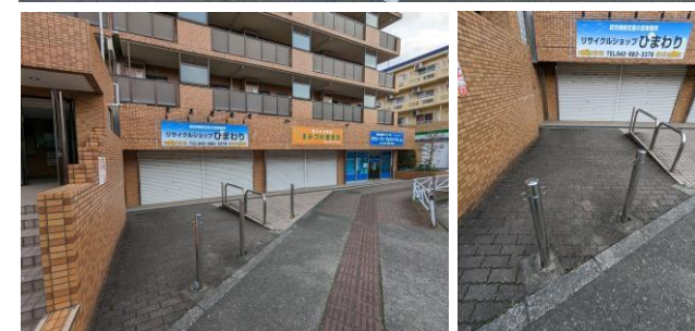
【店舗前：歩道・共用部分】 【店舗前：スロープ・共用部分】