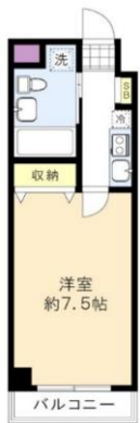
※図面と現況に相違がある場合は、現況を優先と致します。※80m=1分