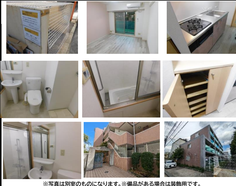
※写真は別室のものになります。※備品がある場合は装飾用です。