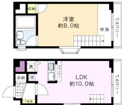
※図面と現況に相違がある場合は、現況を優先と致します。※80m=1分

駅までの道のり平坦、新横浜駅まで徒歩圏内、ペット相談 閑静な住宅街 角部屋 2面採光 外観タイル張り 24時間セキュリティ デザイナーズ 管理人巡回、猫飼育可能です！2ロコンロ有！独立洗面台・クローゼットあり！宅配BOX有り おしゃれなエントランスに休憩スペース有り※先行申込 契約可能！(1番手が先行申込、2番手が先行契約の場合は無条件で2番手が繰り上がります。)