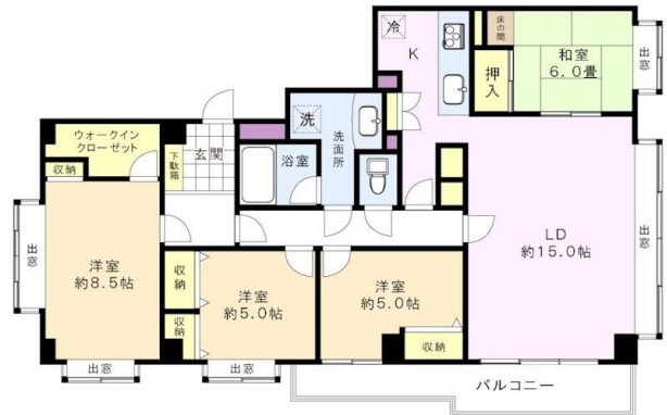
※図面と現況に相違がある場合は、現況を優先と致します。※80m=1分

ペット相談可能な鉄筋コンクリートの造り！3口のシステムキッチンで使い勝手のいい間取です。 洋室3部屋、和室1部屋の4LDKの間取り！ファミリーの方一人一人お部屋が持てるのでおすすめです！！オートロック付きでセキュリティも安心！！