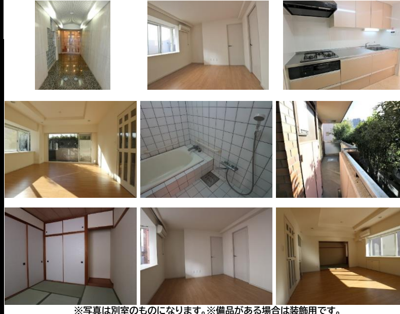
※写真は別室のものになります。※備品がある場合は装飾用です。