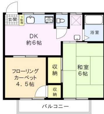
※図面と現況に相違がある場合は、現況を優先と致します。※80m=1分