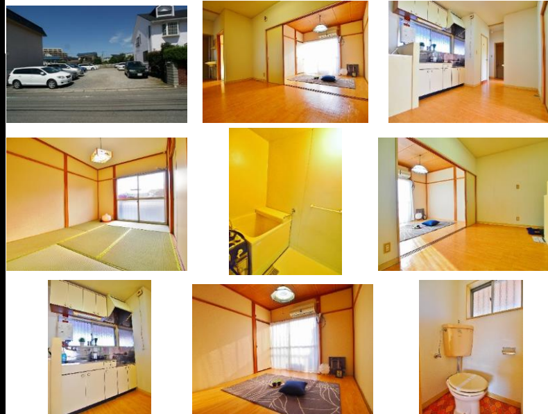
※写真は別室のものになります。※備品がある場合は装飾用です。