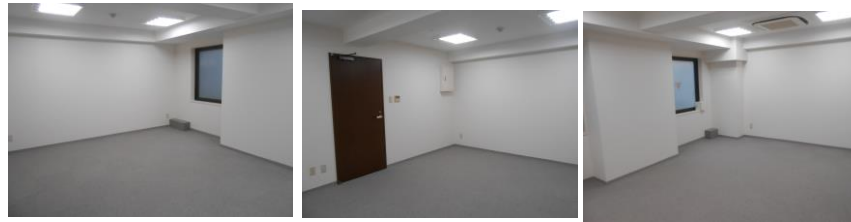
※この図面は概略図です。図面と現況が相違する場合は、現況を優先と致します。