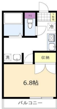
※図面と現況に相違がある場合は、現況を優先と致します。※80m=1分