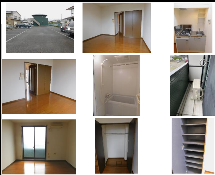
※写真は別室のものになります。※備品がある場合は装飾用です。