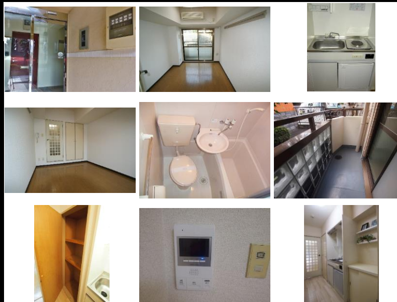
※写真は別室のものになります。※備品がある場合は装飾用です。

賃料発生日ご相談下さい！初期費用キャンペーンは、賃料・管理費・町会費・24時間安心サポート2料(当月+翌月分)、賃貸保証料全て込みです。 ※仲介手数料・月額火災保険料・鍵交換 初期費用キャンペーンは、賃料・管理費・24時間安心サポート2料(当月分)、賃貸保証料全て込みです。※仲介手数料・月額火災保険料・鍵交換費用(任意)は別途必要となります。※賃貸借契約開始後1年未満に解約、又は契約締結後～契約開始日までに解約の場合は違約金として「賃料・管理費・24時間安心入居サポート2料」の2ヶ月分相当額、2年未満の場合