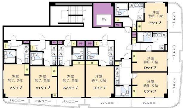
※図面と現況に相違がある場合は、現況を優先と致します。※80m=1分

入学・引越しの学生様、新社会人様賃料発生日ご相談下さい！北野駅は特急停車駅(全列車停車駅)です。宅配ボックス新規設置！オートロック・エレベーター有り。J:COM導入。室内洗濯機置場有り。防犯カメラ・室内物干し・ミラー・節水シャワーヘッド付き。敷金・礼金なし！ガスヒートは基本料(2581円)+別途使用料がかかります。