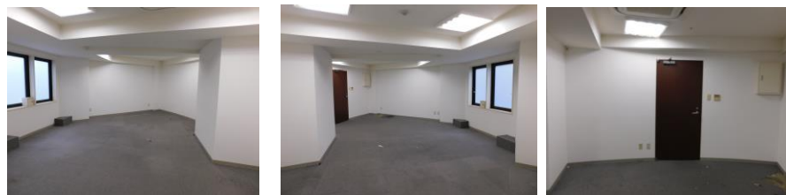
※この図面は概略図です。図面と現況が相違する場合は、現況を優先と致します。