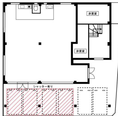
駐車場高さ制限有り（全高1.7mまで）