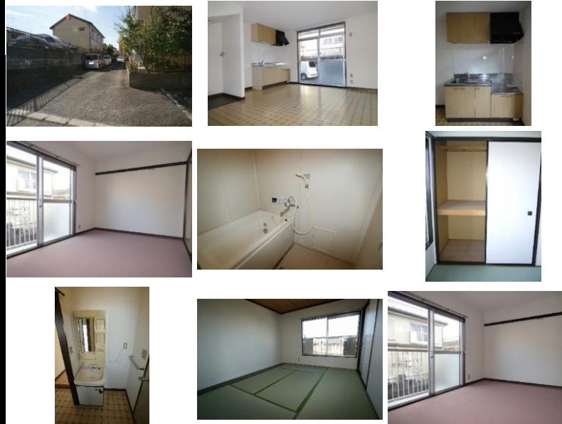
※写真は別室のものになります。※備品がある場合は装飾用です。