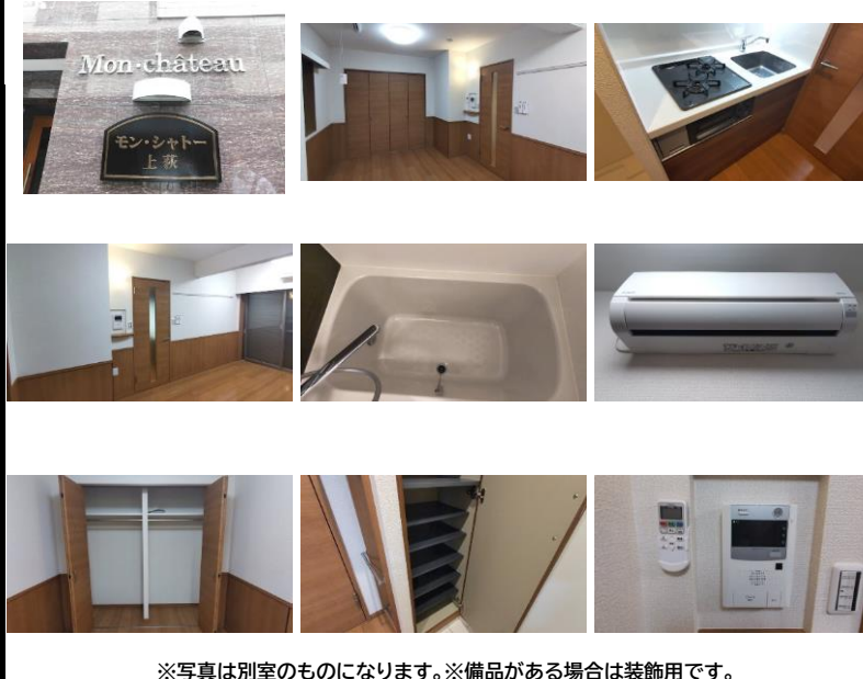
※写真は別室のものになります。※備品がある場合は装飾用です。