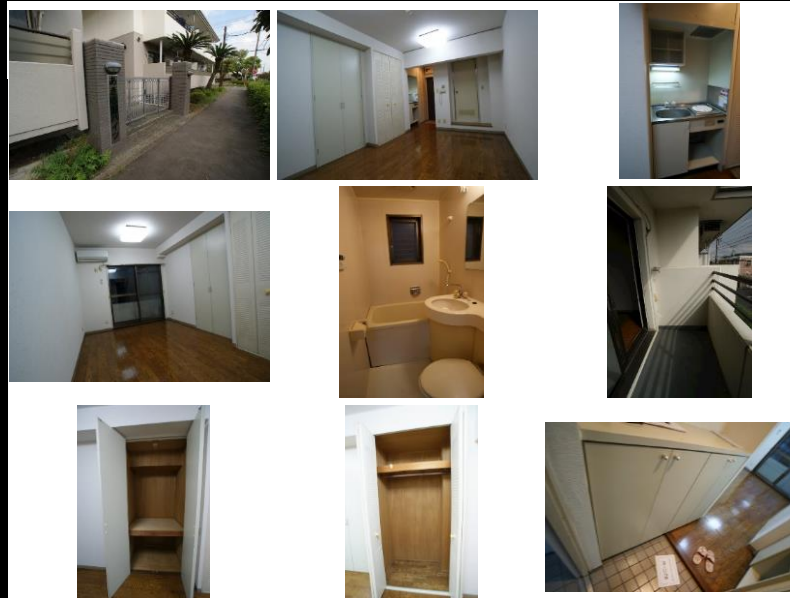
※写真は別室のものになります。※備品がある場合は装飾用です。

初期費用0円キャンペーン！ 初期費用キャンペーンは、賃料・管理費・24時間安心サポート2料(当月+翌月分)、賃貸保証料全て込みです。※先行申込・契約可能！賃貸借契約開始後1年未満に解約、又は契約締結後～契約開始日までに解約の場合は違約金として「賃料・管理費・24時間安心入居サポート2料」の2ヶ月分相当額をお支払い頂きます。