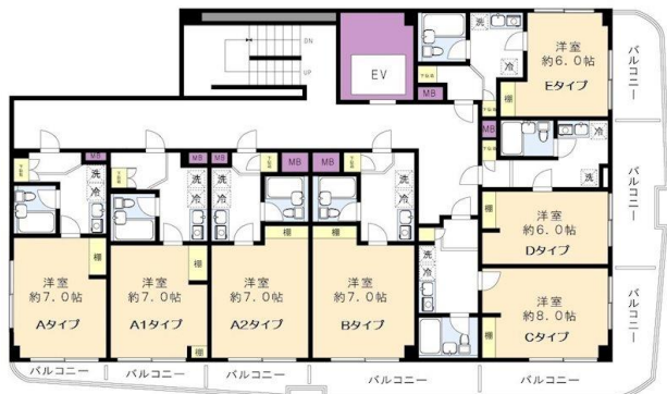
※図面と現況に相違がある場合は、現況を優先と致します。※80m=1分

賃料発生日ご相談下さい！北野駅は特急停車駅(全列車停車駅)です。宅配ボックス新規設置！オートロック・エレベーター有り。J:COM導入。室内洗濯機置場有り。防犯カメラ・室内物干し、敷金・礼金なし！ガスヒーツは基本料(2581円)+別途使用料がかかります。※キャンペーン適用時、賃貸借契約開始後1年未満に解約の場合又は契約締結後～契約開始日までに解約の場合は違約金として、賃料・管理費・24時間安心サポートⅡ料の1ヶ月相当額をお支払い頂きます。