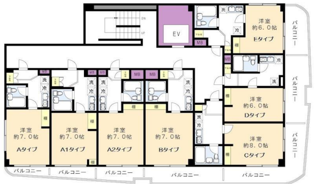
※図面と現況に相違がある場合は、現況を優先と致します。※80m=1分

v入学・引越しの学生様、新社会人様賃料発生日ご相談下さい！北野駅は特急停車駅(全列車停車駅)です。宅配ボックス新規設置！オートロック・エレベーター有り。J:COM導入。室内洗濯機置場有り。防犯カメラ・室内物干し・ミラー・節水シャワーヘッド付き。敷金・礼金なし！ガスヒーツは基本料(2581円)+別途使用料がかかります。