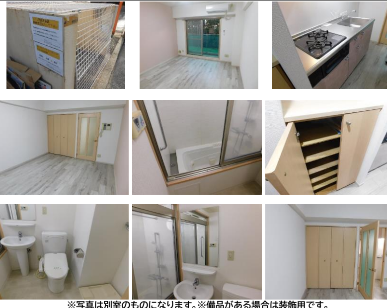
※写真は別室のものになります。※備品がある場合は装飾用です。

ペット相談 閑静な住宅街 角部屋 2面採光 外観タイル張り 24時間セキュリティ デザイナーズ 管理人巡回、猫飼育可能です！2口コンロ有！ 独立洗面台・クローゼットあり！ 宅配BOX有り おしゃれなエントランスに休憩スペース有り※先行申込・契約可能！（1番手が先行申込、2番手が先行契約の場合は無条件で2番手が繰り上がります。）