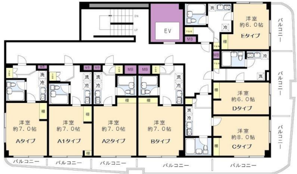
※図面と現況に相違がある場合は、現況を優先と致します。※80m=1分

入学・引越しの学生様、新社会人様賃料発生日ご相談下さい！敷金・礼金無し！北野駅は特急停車駅(全列車停車駅)です。宅配ボックス新規設置！オートロック・エレベーター有り。J:COM導入。室内洗濯機置場有り・防犯カメラ・室内物干し・姿勢・節水シャワーヘッド付き！ガスヒーツは基本料(2581円)+別途使用料がかかります。但し先行申込で2番手が先行契約の場合先行契約のお客様を優先させて頂きますので、ご了承下さい。