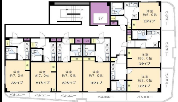
※図面と現況に相違がある場合は、現況を優先と致します。※80m=1分

入学・引越しの学生様、新社会人様賃料発生日ご相談下さい！北野駅は特急停車駅(全列車停車駅)です。宅配ボックス新規設置！オートロック・エレベーター有り。J:COM導入。室内洗濯機置場有り。防犯カメラ・室内物干し・ミラー・節水シャワーヘッド付き。敷金・礼金なし！ガスヒーツは基本料(2581円)+別途使用料がかかります。