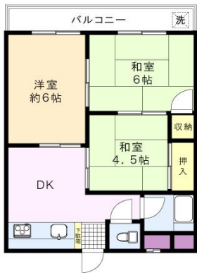
※図面と現況に相違がある場合は、現況を優先と致します。※80m=1分