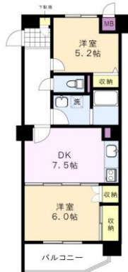
※図面と現況に相違がある場合は、現況を優先と致します。※80m=1分