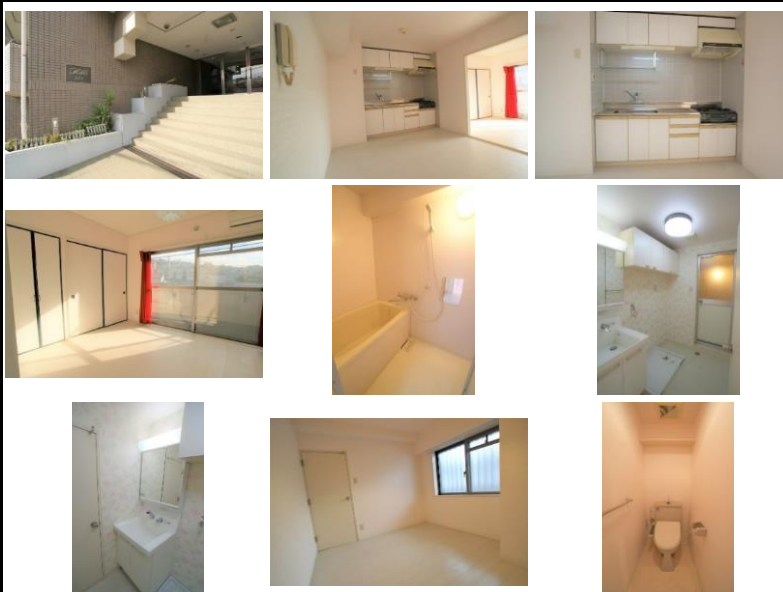
※写真は別室のものになります。※備品がある場合は装飾用です。