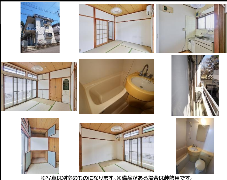
※写真は別室のものになります。※備品がある場合は装飾用です。