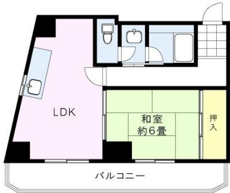
※図面と現況に相違がある場合は、現況を優先と致します。※80m=1分