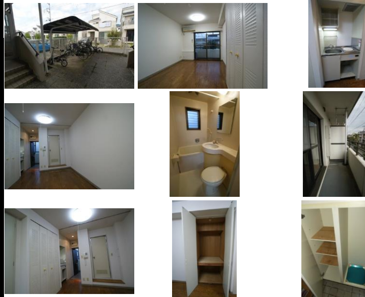
※写真は別室のものになります。※備品がある場合は装飾用です。

初期費用キャンペーンは、賃料・管理費・24時間安心サポート2料(当月+翌月分)、賃貸保証料全て込みです。※仲介手数料・月額火災保険料・鍵交換費用(任意)は別途必要となります。※賃貸借契約開始後1年未満に解約、又は契約締結後～契約開始日までに解約の場合は違約金として「賃料・管理費・24時間安心入居サポート2料」の2ヶ月分相当額をお支払い頂きます。エアコン、カラーモニター付きインターフォン2019年12月新設。