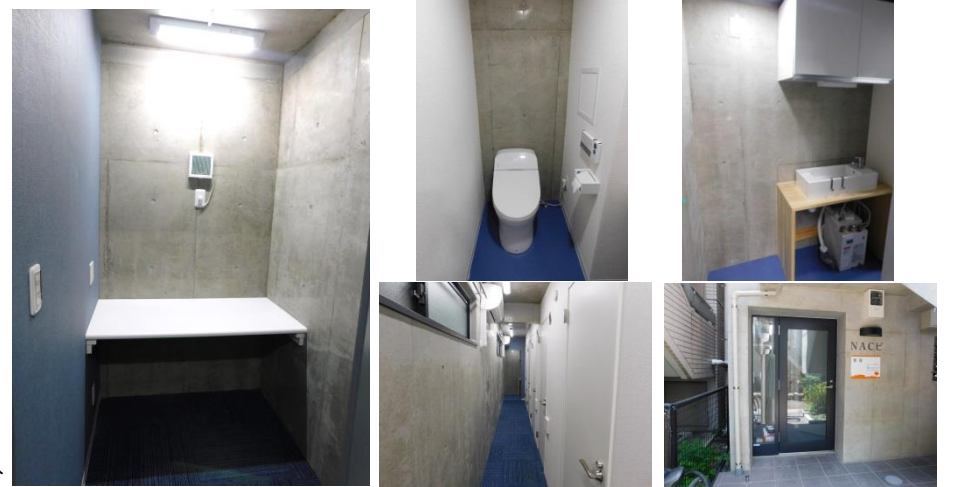
※図面と現況に相違がある場合は、現況を優先致します。※80m=1分

宅地建物取引業 東京都知事（4）第83784号 賃貸住宅管理業 国土交通大臣（2）第2919号 エステーター株式会社 TEL: 042-643-2255 広告掲載：御社HPのみOK ※要広告掲載承諾書（御社書式可）事前送付下さい。 Fax: 042-643-2215 Mail: info@estater.co.jp