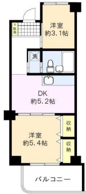
※図面と現況に相違がある場合は、現況を優先と致します。※80m=1分