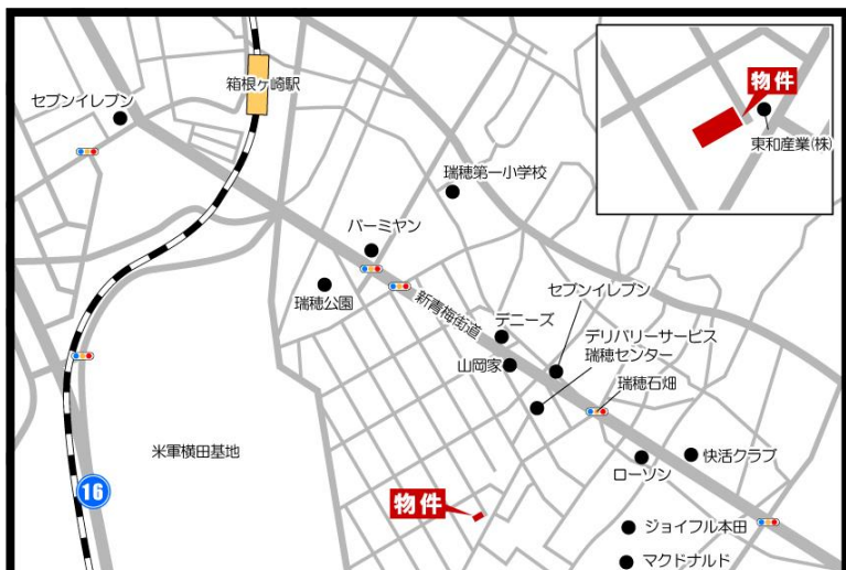
※この図面は概略図です。図面と現況に相違がある場合は、現況を優先と致します。※80m=1分