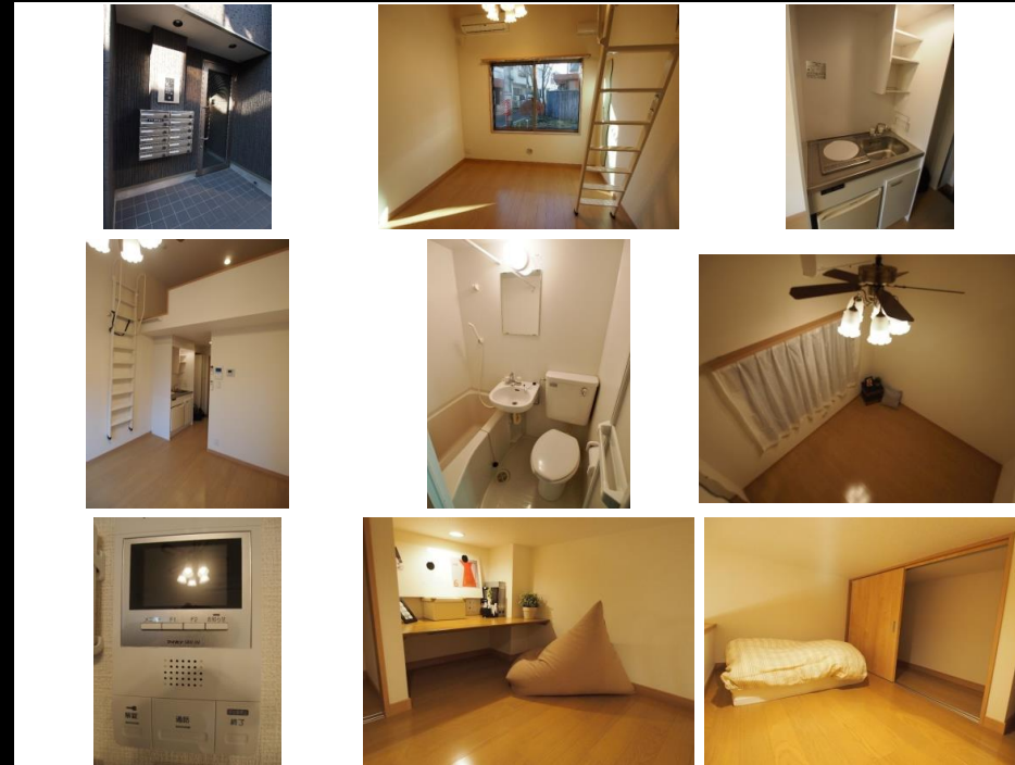
※写真は別室のものになります。※備品がある場合は装飾用です。