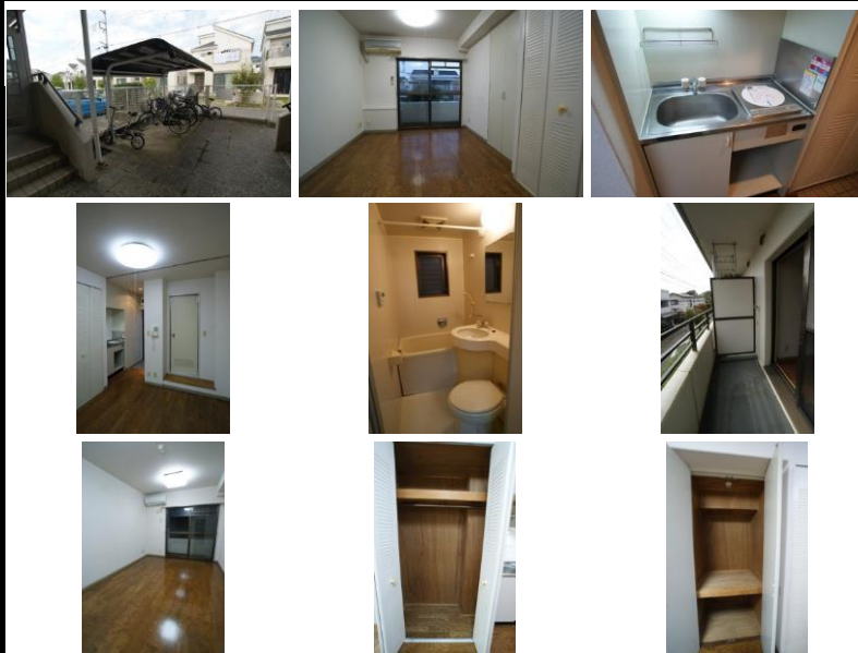
※写真は別室のものになります。※備品がある場合は装飾用です。

初期費用キャンペーンは、賃料・管理費・24時間安心サポート2料（当月+翌月分）、賃貸保証料全て込みです。※仲介手数料・月額火災保険料・鍵交換費用（任意）は別途必要となります。※賃貸借契約開始後1年未満に解約、又は契約締結後～契約開始日までに解約の場合は違約金として「賃料・管理費・24時間安心入居サポート2料」の2ヶ月分相当額をお支払い頂きます。エアコン、カラーモニター付きインターフォン新規入れ替え予定！