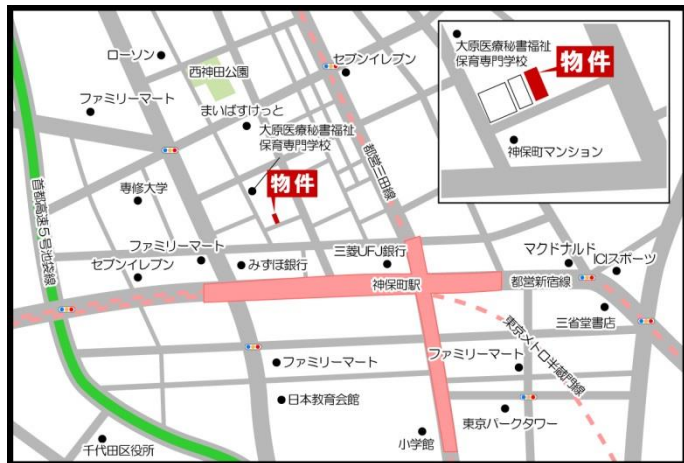
※図面と現況に相違がある場合は、現況を優先致します。※80m=1分

宅地建物取引業 東京都知事 (4) 第83784号 賃貸住宅管理業 国土交通大臣 (2) 第2919号 エステイター株式会社 TEL: 042-643-2255 広告掲載：御社HPのみOK ※要広告掲載承諾書(御社書式可) 事前送付下さい。 Fax: 042-643-2215 Mail: info@estater.co.jp