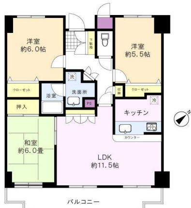
※図面と現況に相違がある場合は、現況を優先と致します。※80m=1分