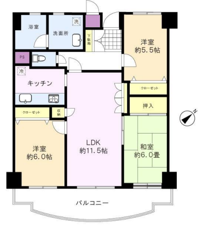
※図面と現況に相違がある場合は、現況を優先と致します。※80m=1分