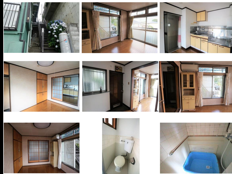
※写真は別室のものになります。※備品がある場合は装飾用です。