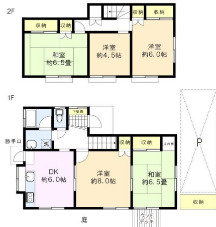
※図面と現況に相違がある場合は、現況を優先と致します。※80m=1分