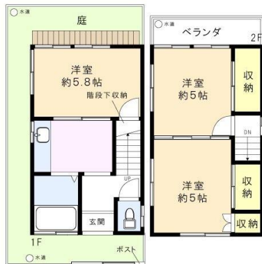
※図面と現況に相違がある場合は、現況を優先と致します。※80m=1分