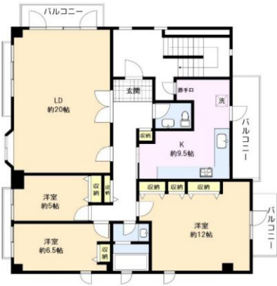
※図面と現況に相違がある場合は、現況を優先と致します。※80cm=1分