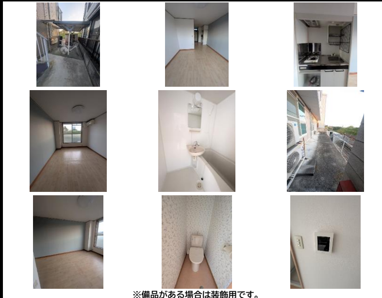
※備品がある場合は装飾用です。

初期費用キャンペーンは、賃料・管理費・24時間安心サポート2料(当月+翌月分)、賃貸保証料全て込みです。火災保険は月払いタイプ。※月額火災保険料・仲介手数料・鍵交換費用(任意)等は別途必要となります。※賃貸借契約開始後1年未滿に解約、又は契約締結後～契約開始日までに解約の場合は違約金として「賃料・管理費・町会費・24時間安心入居サポート2料」の2ヶ月分相当額、賃貸借契約開始後2年未滿に解約の場合は違約金として「賃料・管理費・24時間安心入居サポート2料」の1ヶ月分相当額をお支払い頂きます。